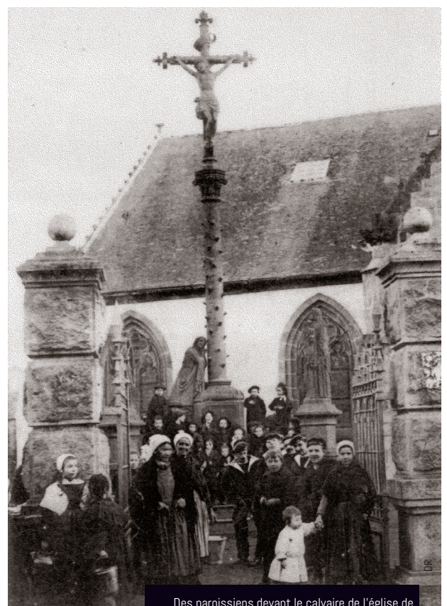
Des paroissiens devant le calvaire de l'église de Guipavas au début des années 1900.

Yann Larc'hantec (1829-1913) fut à la tête d'un atelier de sculpture à Morlaix puis à Landerneau, regroupant vers 1890 plus de 20 tailleurs de pierre et maçons. Il réalisera plus de 130 chantiers de calvaires dans le Finistère, ainsi que la construction ou la restauration de monuments et sculptures dans de nombreuses églises.