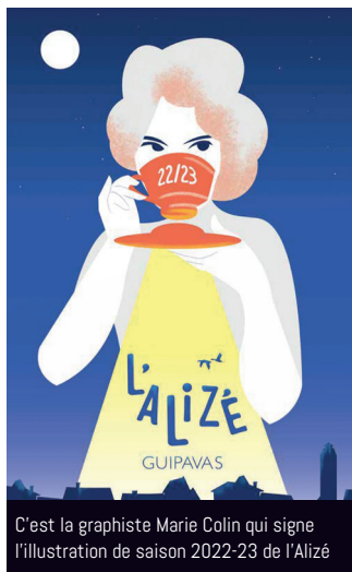
C'est la graphiste Marie Colin qui signe l'illustration de saison 2022-23 de l'Alizé